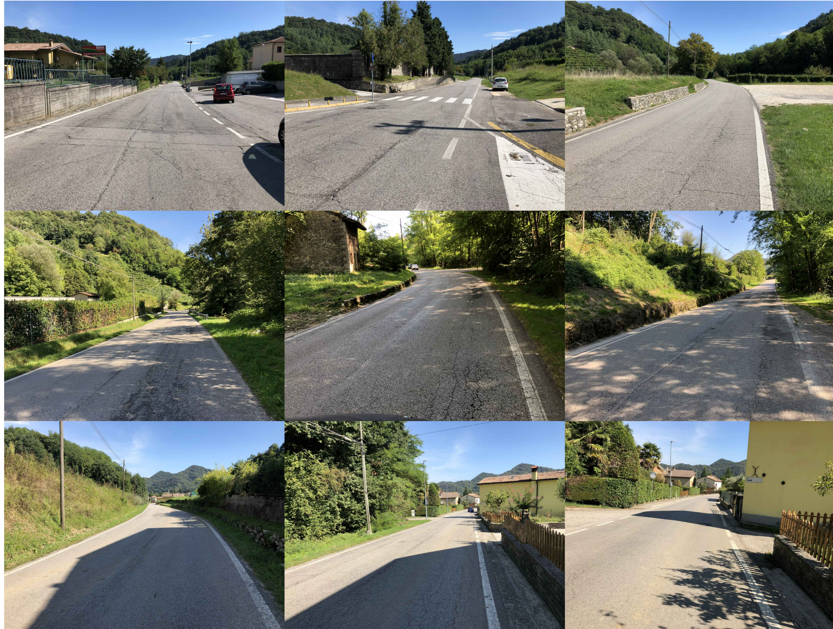
fine tratto oggetto di intervento