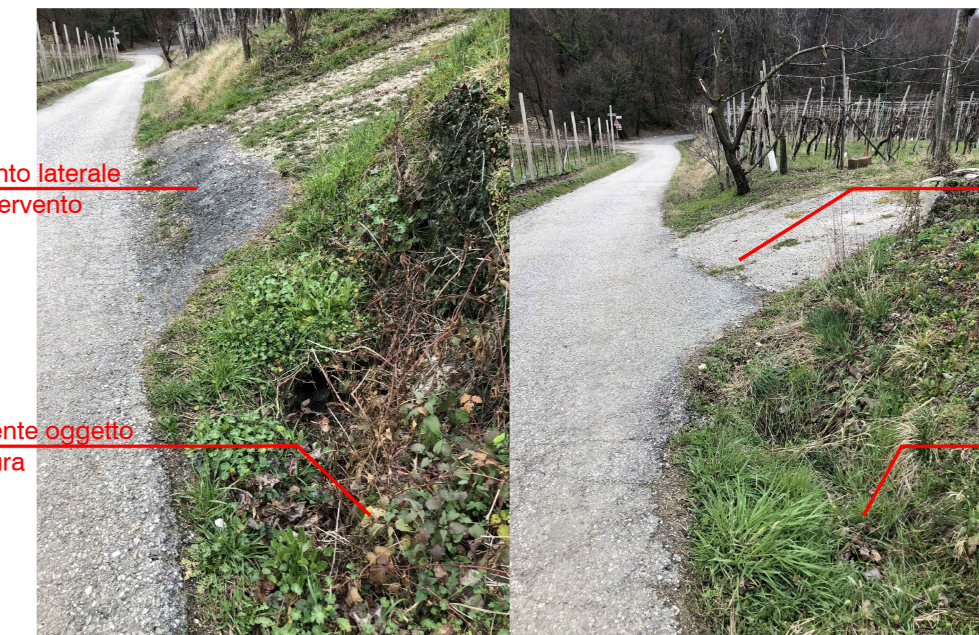
attraversamenti laterali oggetto di intervento