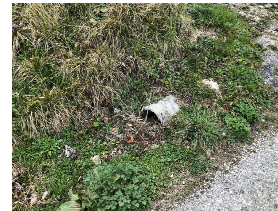
fossato esistente oggetto di risagomatura