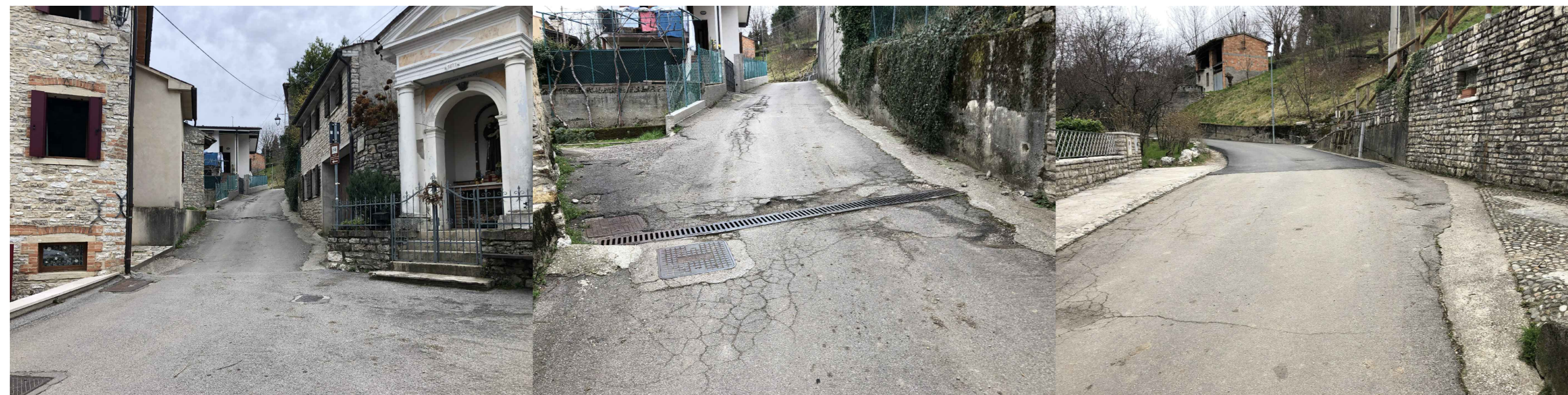
fine tratto oggetto di intervento - 1