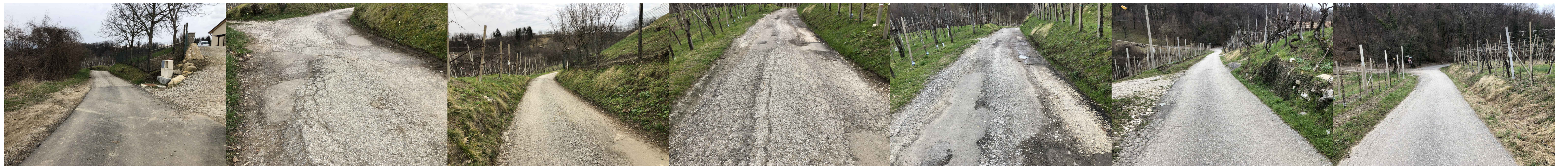
fine tratto oggetto di intervento - 2